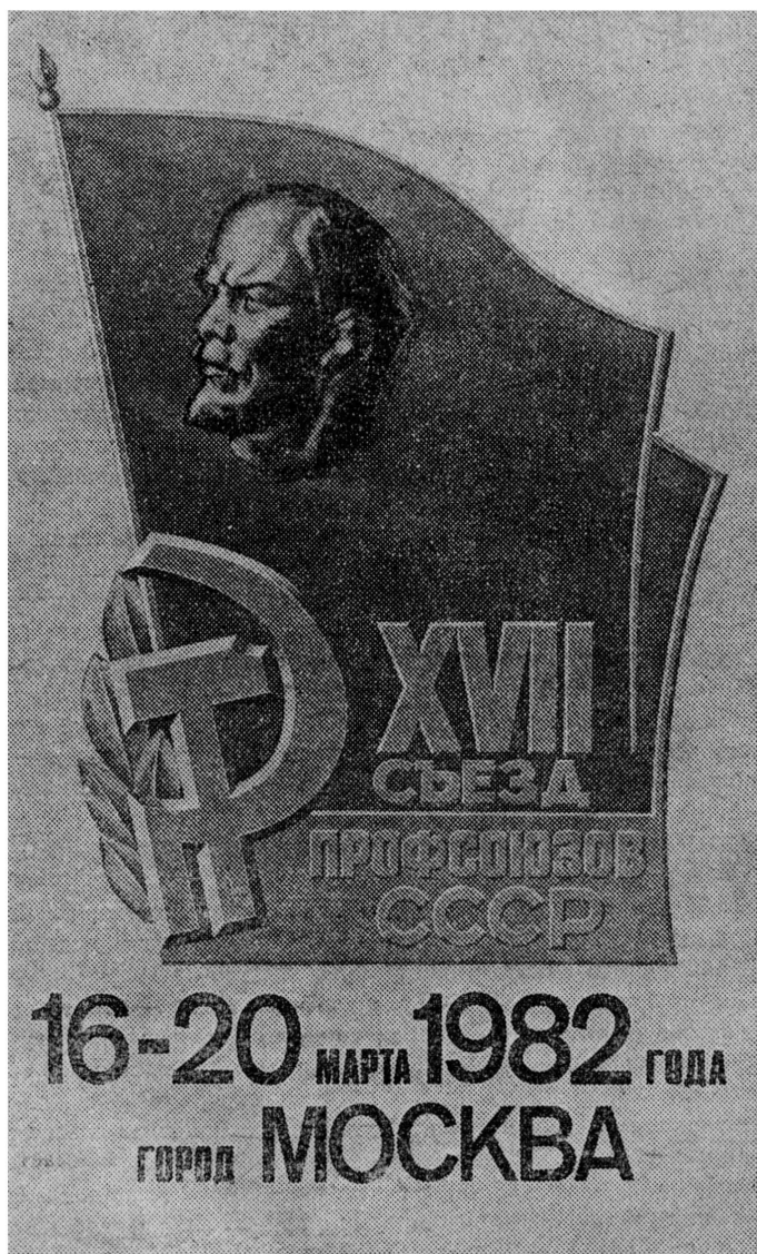
Плакат художника С. Качанова. Издательство «Плакат».